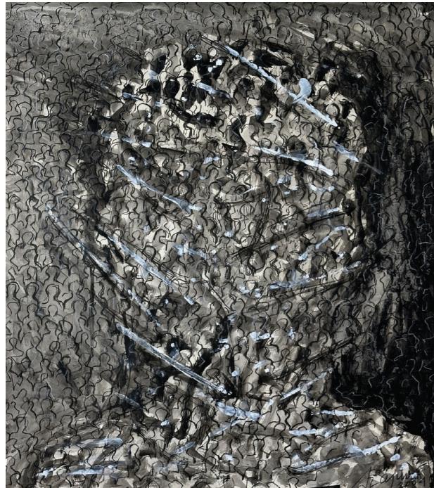
Józef Szajna z cyklu Mrowiska, własność MDSM w Oświęcimiu