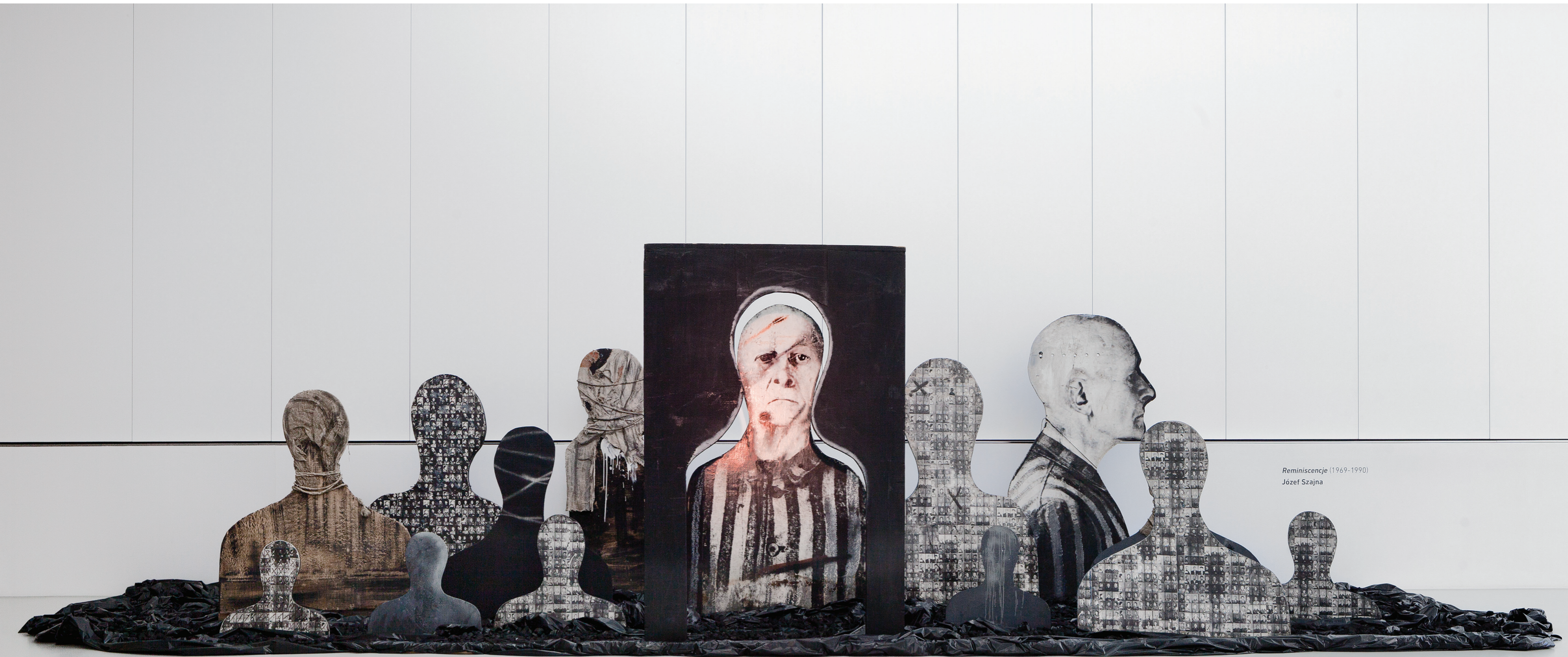
Reminiscence (1969-1990) Józef Szajna