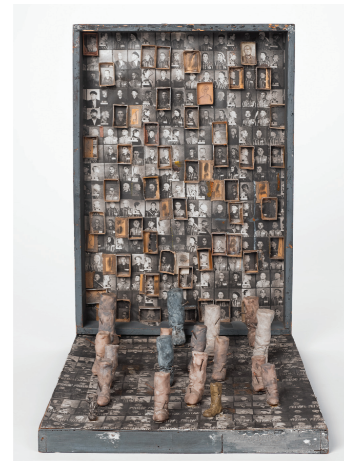
Józef Szajna Drang nach Osten – Drang nach Westen (1987) własność Muzeum Śląskie w Katowicach

Józef Szajna urodził się 13 marca 1922 r. w Rzeszowie, zmarł 24 czerwca 2008 r. w Warszawie. To jeden z najwybitniejszych artystów świata teatru i sztuki. Malarz, scenograf, reżyser, teoretyk teatru, twórca autorskich, nowatorskich przedstawień. Więźniem KL Auschwitz i Buchenwaldu. Doświadczenia Szajny z okresu II wojny światowej, w tym wieloletni pobyt w obozach koncentracyjnych, oraz ich materialne przejawy w jego twórczości są niepodważalnym dziedzictwem kulturowym. Warsztat artystyczny nabyty w Akademii Sztuk Pięknych w Krakowie w zderzeniu z traumatycznym doświadczeniem osobistym, kształtuje Szajnę jako jednostkę wybitną w skali ogólnopolskiej i międzynarodowej.